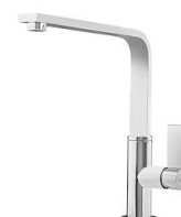
Monomando NYC 8486 000