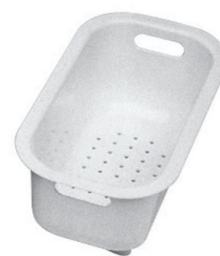
escurre pasta blanco 8151 100