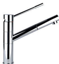
Monomando Lorenzo 8466 000