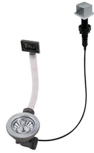
Desagüe automático LIRA 8407 103